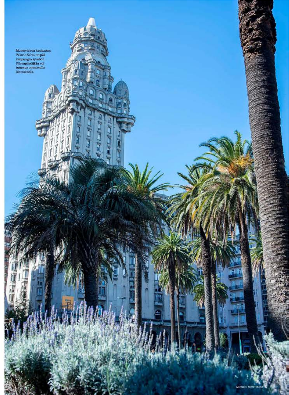
Montevideon keskeisintä Palacio Salvo on pääkaupungin symboli. Pilvenpiirtäjään voi tutustua opastetulla kierroksella.

Sitä kukaan matkailija tuskin voi jättää kaipailemaan: Uruguayssa riittää yllin kyllin muuta nautiskeltavaa. ●