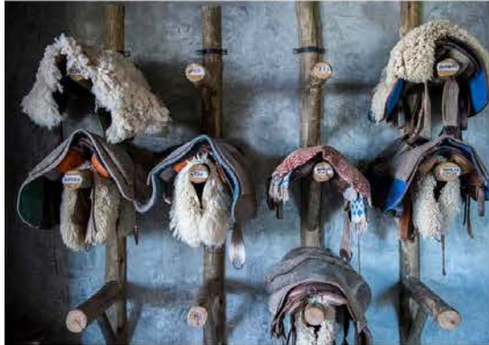
42 MONDO HUNTIKUU

Keskustasta löytyvä niemi kalasatamainen on kaupungin viehättävimpiä alueita, jossa on merenrantimia ja lihaa tarjoavia parrilla -ravintoloita. Satamasta voi tehdä veneretken liha de Loboksen länsisaarelle, jossa elää yli 200 000 merileijonaa. Se on maailman toiseksi suurin merileijonayhdyksunta. Retkellä tarjoutuu mahdollisuus uida märkäpuvussa näiden nopeiden otusten kanssa samoissa vesissä.