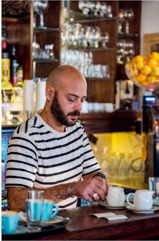
A. Pääkaupunki Montevideoon löytyy hyviä ravintoloita ja idyllisiä kahviloita. Café Brasileo sijaitsee vanhan kaupungin eli Ciudad Viejan alueella.

Montevideon yleisilme muistuttaa sitä, että Uruguay on Etelä-Amerikan elämäntautilastojen ykkönen. Sitä pidetään usein myös mantereen demokraattisimpana ja vähiten korruptoituneena valtiona.